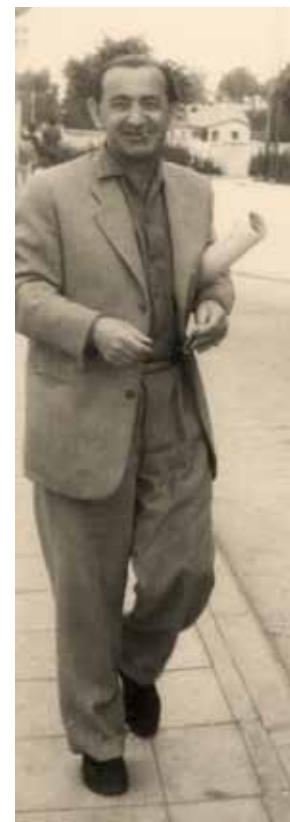
חיים היינץ פנחל בתל אביב, שנות החמישים

מפגש עם יצירתו של האדריכל והמעצב חיים היינץ פנחל (1906 – 1988) בתערוכה במוזיאון בית ראובן בתל-אביב