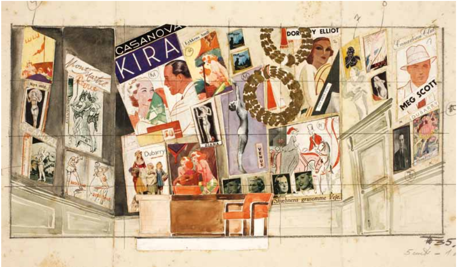
מתווה לתפאורת סרט, ברלין, 1935

ובעיקר בחוף השנהב. מלון איבואר באבידז'אן והמרכז המונומנטלי שהוקם סביבו היה במידה רבה פרי של שיתוף פעולה יצירתי בין היום והמתכנן. פנחל תכנן את כל חלקי הפרויקט: מלון, מרכז קונגרסים, קזינו, אולמות קולנוע, מסעדות, סופרמרקט, משטחי החלקה על קרח ובריכות שחייה, כשהוא מטפל בתכנון עד לפרטי פרטים של עיטורי תקרות או חיפויי קירות בדגמים גיאומטריים, בהשראת התרבות האפריקאית. כמנהגו גייס פנחל אמנים ישראלים רבים כדי לשתף עמו פעולה ולעטר את המבנים ברוח המקום. נדמה כי העבודה באפריקה זימנה לו תחושת חופש וגירוי להפגיש בין המודרניים האירופי שבתוכו צמח לבין עולם צורני מופשט בהשראת אמנות אתנית.