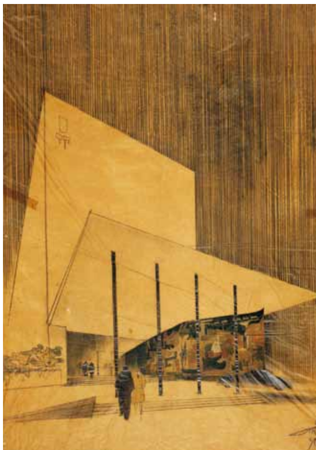
מתווה לחיות מלון דן תל אביב, 1949